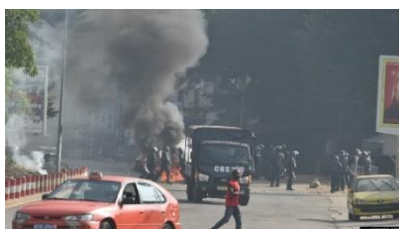
Figure 1 : Anono, le 13 août 2020, la brigade anti-émeute dispersant les manifestants ayant dressé des barricades sur les voies (Images prises par Issouf Sanogo/AFP, Agence France Presse)

Le 20 septembre 2020, soit 40 jours avant les élections, Henri Konan Bédié, au nom de l'opposition, lance un appel à la désobéissance civile par cette déclaration : « Face à la forfaiture, un seul mot d'ordre : la désobéissance civile ». Cet appel, relayé par les autres leaders de l'opposition ont produit, à leur tour, des impacts se traduisant par des manifestations dans plusieurs localités du pays. Au niveau d'Abidjan, des barricades sont érigés dans plusieurs quartiers, comme le montre les figures 1 et 2.