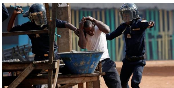
Image 3 : Un manifestant appréhendé par les forces de l'ordre dans la commune de Yopougon.

Ces manifestations se sont étendues à plusieurs villes de l'intérieur du pays dont Bonoua, terre natale de Simone Gbagbo, l'ex-première dame de Côte d'Ivoire. Dans cette localité, il y a eu une véritable opposition entre les manifestants et la police au point où la route internationale menant au Ghana est restée obstruée pendant plusieurs heures. Selon les témoignages recueillis, ces affrontements auraient