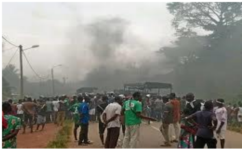
Image 4 : Bonoua, groupe de manifestants sur la route menant au Ghana. (Image publiée par Jeune Afrique du 13/08/2020).

enregistré « deux morts » du côté des manifestants qui, à leur tour, auraient « détruit et incendié le commissariat de police » local.