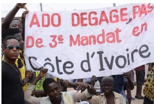
Image 2 : Port-Bouet, des manifestants brandissant des pancartes véhiculant des slogans contre AO et le troisième mandat.